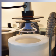
水洗いステーション