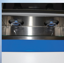
ローディングステーション